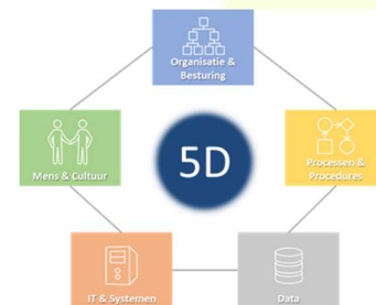
Figuur 2: 5D methode – in samenhang implementeren

De Green Rock proces game is één van de producten uit onze 5D-methode. 5D staat voor de vijf dimensies die bij ieder project in balans horen te zijn om het optimale resultaat te kunnen bereiken. Dit zijn Organisatie & Besturing, Processen & Procedures, Data, Mens & Cultuur en IT & Systemen.